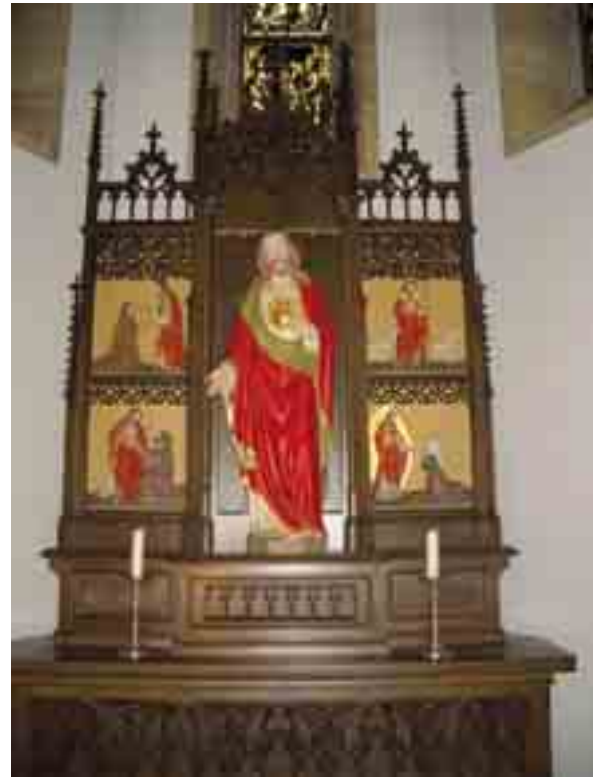
Seitenaltar St. Lambertus - Kirche Langenberg. Figuren von Christoph Siebe.

Der Verein wird für das Gelände des neuen Heimatmuseums einen Rosenstrauch spenden, um so die Verbindung zur „Wiedenbrücker Schule“ auch sichtbar und nachhaltig zu dokumentieren.