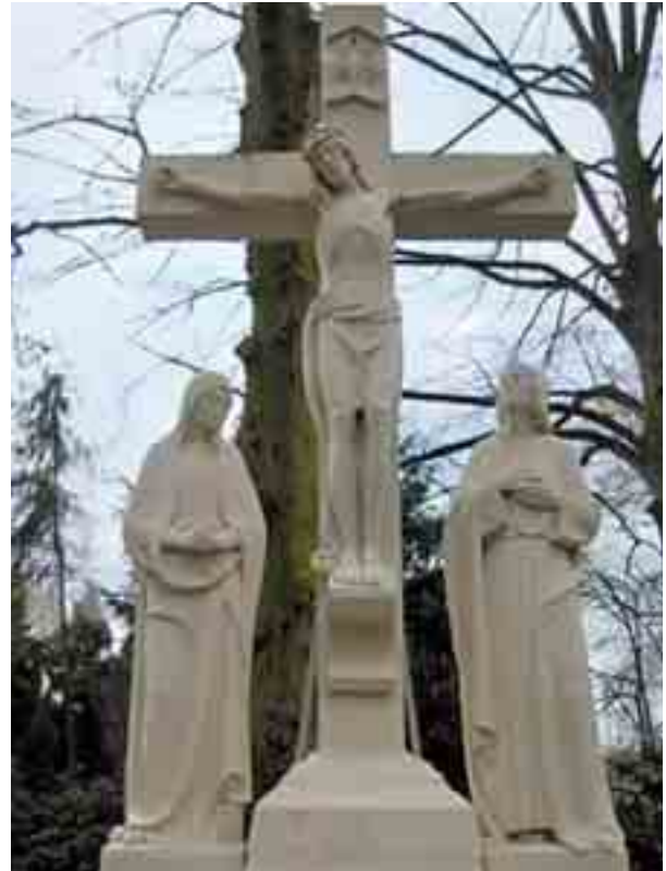
Friedhofskreuz in Wiedenbrück von Christoph Siebe, dem 1. Vorsitzenden der 1883 gegründeten „Hoffnung“

Ihr seid nicht tot, sondern nur untergegangen wie die Sonne. Nicht bei den Toten suchen wir euch, sondern im Chor der Seligen des Himmels.