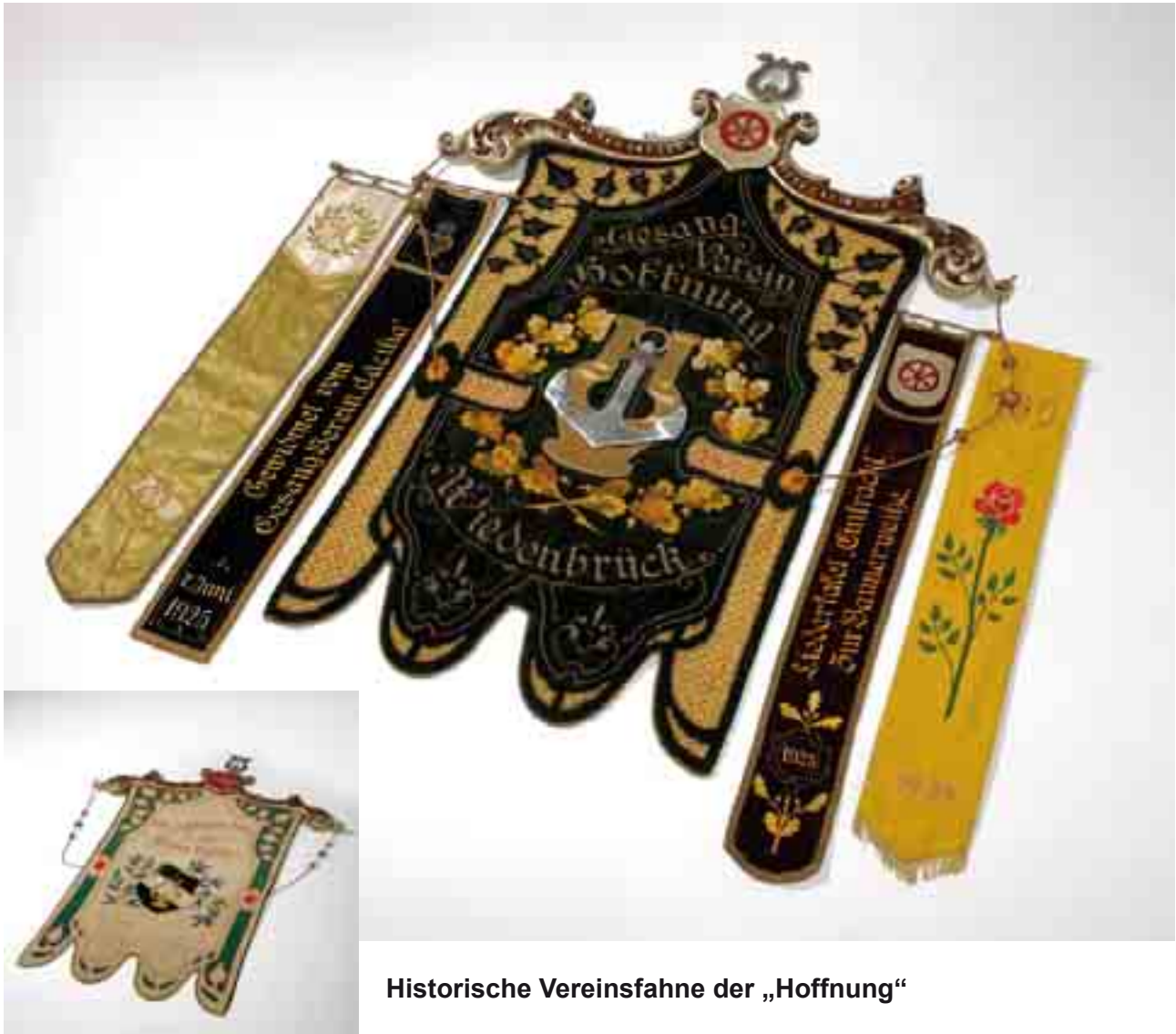
Historische Vereinsfahne der „Hoffnung“