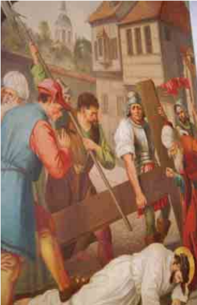
Kreuzweg St. Aegidius - Kirche Wiedenbrück von dem Gründungsmitglied Heinrich Waller.